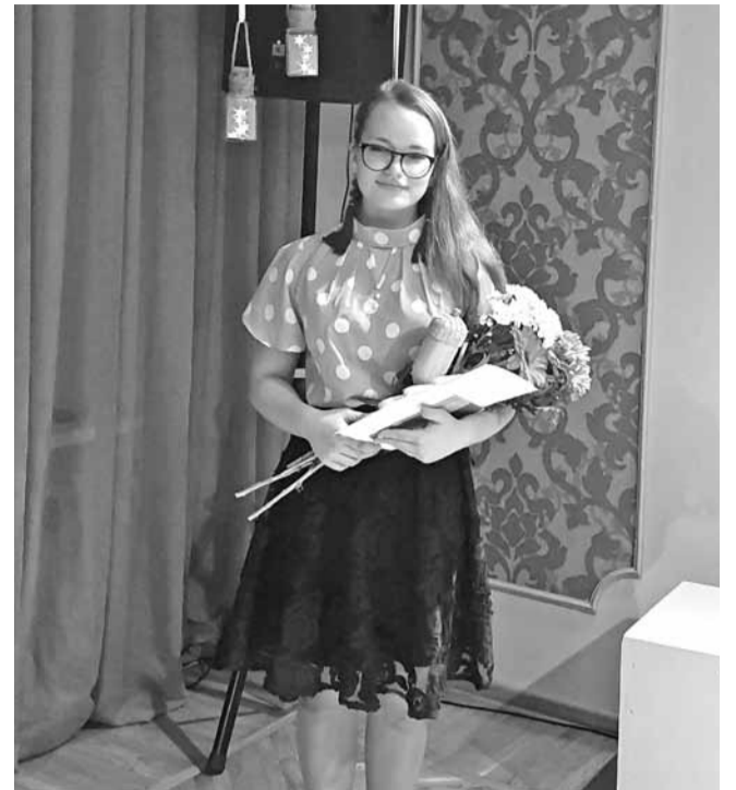
2019.gada jaunais mākslinieks

Tie ir danči folkloras kopā „Lākači.” Man ļoti patīk dejot līdz spēku izsīkumam, jo dejošana sniedz tikai pozitīvas emocijas.